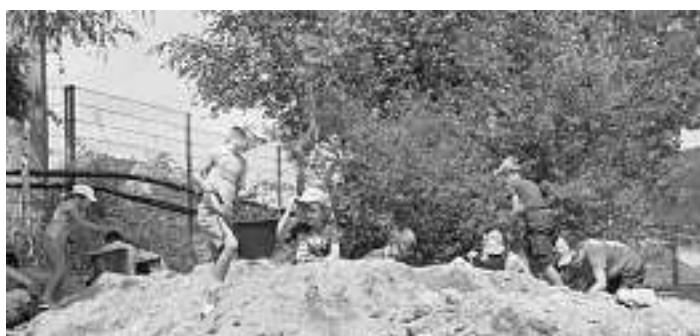
Außerdem hat jedes Kind eine Urkunde mit dem gefundenen „Gold“ erhalten.