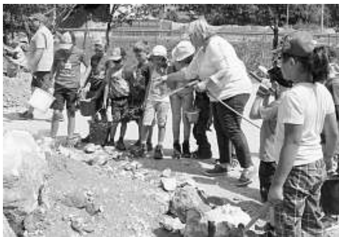
Danach durften die Kinder auf dem abgetrennten Areal der Mineralienhalde der Grube Clara Steine klopfen, schöne Steine suchen und mit nach Hause nehmen sowie „Gold waschen“.