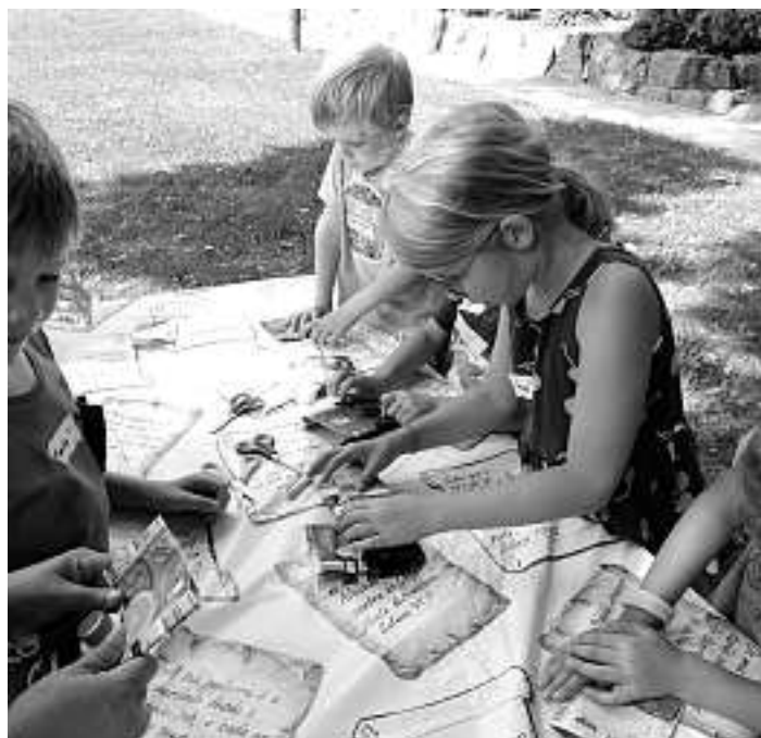
Spülmittelflaschen wurden zu Pups-Instrumenten und Tetra-Paks zu Geldbeutel recycelt, beim Müllberg-Triathlon konnten die Kinder ihre Geschicklichkeit unter Beweis stellen und Fische vorbei am störenden Müll angeln. Zum Abschluss sangen alle Kinder gemeinsam mit dem siebenköpfigen Betreuersteam das Olchi-Lied und die Kinder erhielten eine Urkunde, die sie als Olchi-Kennerin bzw. Olchi-Kenner ausweist. Die Wolfacher Bücherei bleibt bis zum Ende der Sommerferien geschlossen. Der nächste Ausleihtag nach den Ferien

Seit Jahren zählen die Bände der Olchi-Reihe von Erhard Dietl zu den meistausgeliehenen Kinderbüchern in der Katholischen Öffentlichen Bücherei Wolfach. Da lag es für das Bücherei-Team nahe, doch einmal für das gemeinsame Ferienprogramm Wolfach/Oberwolfach einen Ausflug in die Heimat der Olchi-Familie, den Müllberg in Schmuddelfing, anzubieten. Olchis ernähren sich bekanntermaßen von Müll und hassen alles, was sauber und ordentlich ist. Nach einem gemeinsamen Start mit der Geschichte vom Geburtstagsfest des Hausdrachens der Olchis ging es für die 25 Kinder in vier Gruppen auf den Spuren der Olchis rund um den Wolfacher Kirchplatz.