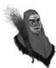
Lempi Hexengilde Oberwolfach