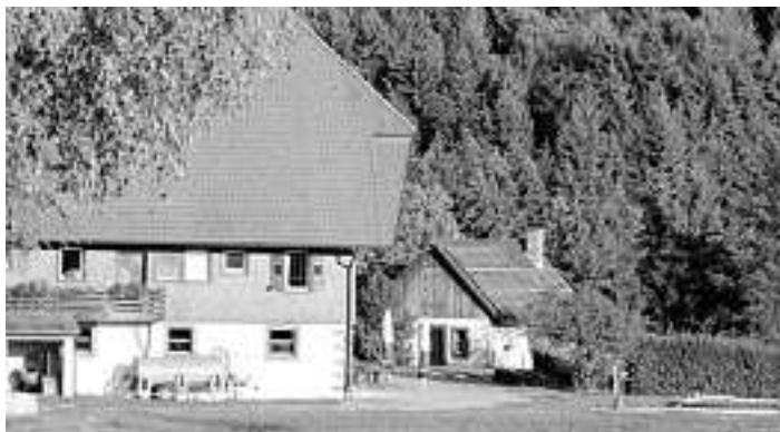
Start und Ziel der Rundwanderung ist der Schwenkenhof oberhalb von Schiltach.