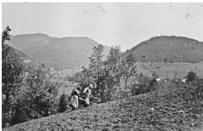
Bild Nr. 728: Feldarbeit oberhalb des Hackerjockelehofes mit Blick auf Wolfach und das grüne Tal, in dem noch wenig Besiedlung zu erkennen ist. Das Bild stammt aus der Zeit um 1935.