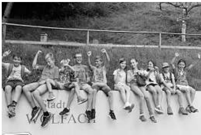
Die Tour führte rund um den Vorstadtberg und dauerte ca. 2 Stunden. Zum Abschluss gab es ein Eis zur Abkühlung.