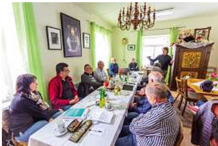
Bild der Weiterbildung im Alten Rathaus in Kirnbach

Abschließend bedankte sich Siegbert Armbruster bei allen Teilnehmern „für die Bereitschaft, an einem Samstagnachmittag für fast drei Stunden zusammen zu kommen“. Mit leckerem Wurstsalat und süßem Honigbrot vom Team des Alten Rathaus in Kirnbach klang eine konstruktive und informative Weiterbildung der Wolfach Wegewarte aus.