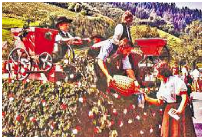
Bild 931 Beim großen Festumzug zum 700jährigen Gemeindejubiläum wurde auch das Mosten als typisch bäuerliche Tätigkeit vor allem in den Monaten Oktober und November demonstriert. Unterwegs schenkte damals Konrad Faist von „s Waldhanse“ (?) den am heißen Sommertag besonders durstigen Zuschauern und auch den Teilnehmern großzügig ein.