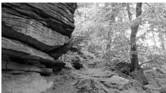
Auf dem erlebnisreichen Bad Teinacher Genießerpfad