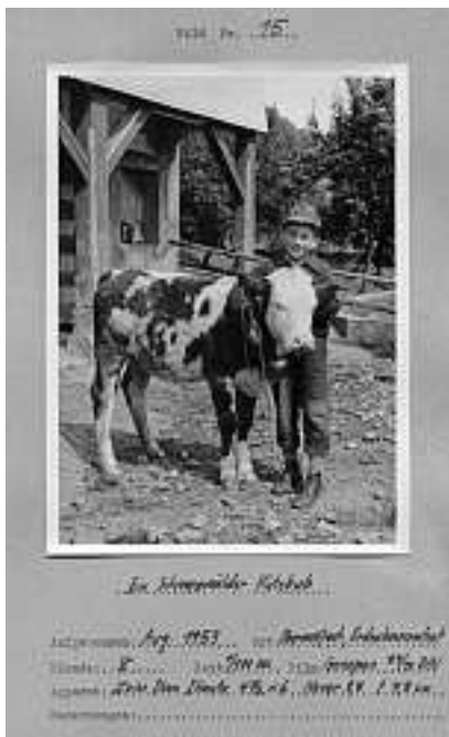
Foto – Nr. 773: Viele interessante Foto-Dokumente aus der Zeit um 1950 bis 1970 hat Hobby-Fotograf Otmar Rogg den Oberwolfachern hinterlassen. Besonders präsent ist dabei die Musikkapelle, in der er als Klarinetist und kurze Zeit auch als Dirigent aktiv mitwirkte. Aber es gibt auch viele Dokumente von den Ausflügen des Kirchenchores und vom dörflichen und kirchlichen Leben allgemein. Dieses Fotoblatt mit genauen technischen Angaben gibt auch weitere Auskunft: „Schwarzwälder Hütebub“, Erdenbauernhof August 1953!