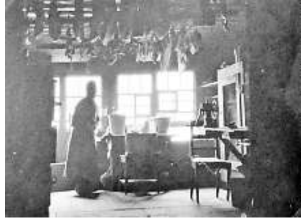
Bild Nr. 724: Foto von Werner Rohr um 1935: Blick in die „Rauchkuchi“ des Hackerjockelehofes – mit reichhaltigem Deckenbehang!