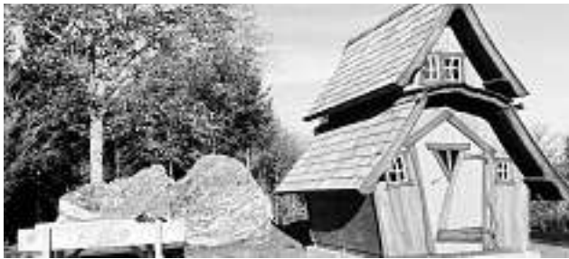
Foto: Hexenhäuschen auf dem Sohlberg

Die anspruchsvolle Rundwanderung führt uns auf den Höhenkamm von Lautenbach im Renthal. Über historische Wege wie dem Allerheiligensteig und auf neu angelegten Pfaden geht es durch eine abwechslungsreiche Landschaft mit herrlichen Aussichtspunkten mit weiter Sicht nach Straßburg und zu den Vogesen. Ein wahres Schmuckstück ist das Hexenhäuschen auf dem Sohlberg. Die gesamte Strecke ist 15 Kilometer lang. Der Aufstieg und Abstieg betragen jeweils 559 Meter. Es wird empfohlen, festes Schuhwerk, Rucksackverpflegung und ausreichend Getränke sowie Wetterschutzkleidung mitzunehmen. Auch an Wanderstöcke sollte man denken. Man trifft sich am Sonntag, 21. Juli, um 7.30 Uhr am Schulplatz in Oberwolfach. Dort werden Fahrgemeinschaften bis nach Wolfach zum Bahnhof gebildet. Die Abfahrt mit der Bahn (OSB) ist um 8.20 Uhr. Hier werden Gruppenfahrtscheine gelöst. Auch Nichtmitglieder und Gäste sind zur Teilnahme eingeladen!