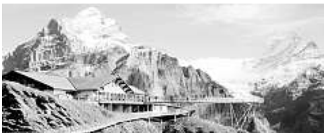
Foto: Wanderregion bei Grindelwald als Ziel der Oberwolfacher Bergwanderer

Am Dienstag, 23. Juli, um 20 Uhr treffen sich die Teilnehmer am Lindenplatz („Posthörnle“ oder „Linde“) zu einer Tourvorbesprechung, bei der u. a. Fahrer und Abfahrtszeit geregelt werden