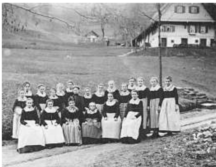
Foto -Nr. 760: Nun ein weiteres „Suchbild“, das aus Bad Peterstal nach Oberwolfach gekommen ist. Es wird vermutet, dass es sich um einen Hof im Wolfstal handelt. Interessant ist, dass nur die weiblichen Bewohner bzw. das weibliche Gesinde fotografiert wurde! Beim näheren Betrachten der Kleidung scheint jedoch der Hinweis auf das Wolfstal nicht unbedingt richtig zu sein.

Zu Foto-Nr. 759: Erfreulicherweise gab es vier Rückmeldungen, die allesamt einen deutlichen Hinweis auf den Bereich der Abzweigung zum Kupferberg in Schapbach gaben. Somit dürfte die Angelegenheit geklärt sein! Vielen Dank!