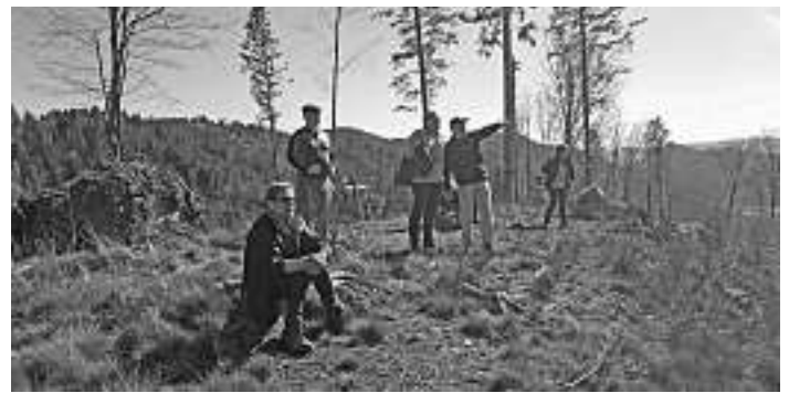
Immer wieder genoss man die Ausblicke ins Tal und die umgebenden Bergrücken

Für die spürbar mit viel Liebe zur Natur und zur Heimat ausgearbeiteten Tour dankten alle Teilnehmer dem umsichtigen Wanderführer.