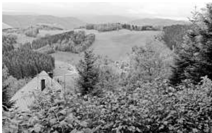
Am zweiten Tag geht es über den sagenumwobenen Schwarzenbruch!

Für beide Touren sollte man je ein Rucksackvesper einpacken. Willkommen sind auch Gäste und Nichtmitglieder. Wanderführer Rolf Armbruster ist ein erfahrener Wanderer des Schwarzwaldvereins Oberwolfach. Natürlich kann man sich je nach Lust und Laune oder zur Zeitsituation auch auf die Teilnahme an nur einer Wanderung beschränken!