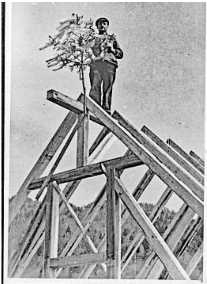
ÜBERDACHUNG DER EINFABRT -HINTERER TEIL DES HAUSES - 1946

Diverse Gaststätten, Oberwolfach MundArt - Wanderndes Oktoberfest Heimatschätze - eine kulinarische Wanderung durch Ober- wolfachs Küchen. Fünf Oberwolfacher Gastronomen werden die Teilnehmer entlang der Wanderroute mit abwechslungsreichen, kulinarischen Gängen und Spezial- itäten aus der Region verwöhnen. Insgesamt können drei Gruppen zu verschiedenen Startzeiten, um 12.30 Uhr , 14.00 Uhr und 15.30 Uhr, vom Landgasthof Walkenstein aus auf die Strecke. Karten für das Wandernde Oktoberfest gibt es wie immer im Vorverkauf bei den Geschäftsstellen der Volksbank Mittler Schwarzwald eG und der Sparkasse Wolfach und kosten 48 Euro pro Person. Wer sich an der Tageskasse im Landgasthof Walkenstein noch mit Rest- karten eindecken möchte, zahlt 51 Euro.