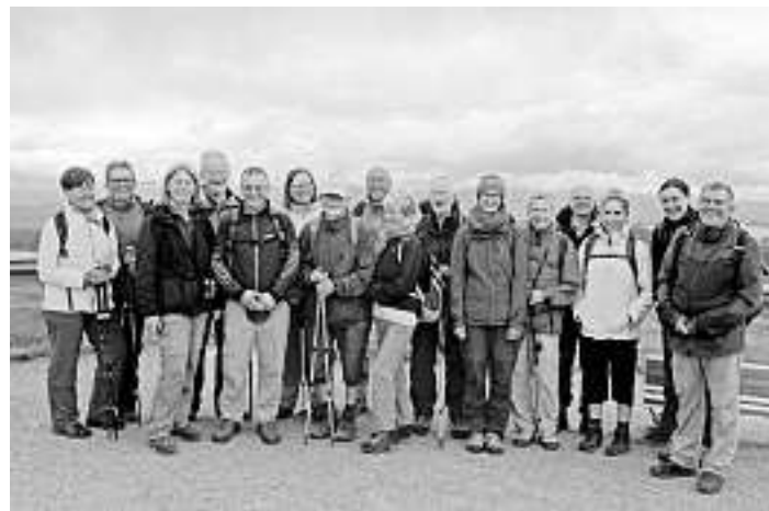
Foto: Die froh gesinnte Wandergruppe am Feldberg