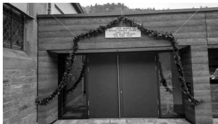
„Eingangstür Neues Gemeindezentrum mit Girlande“