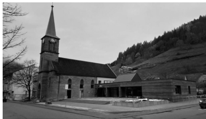
„Ev. Stadtkirche Wolfach“

Die erste Gelegenheit zum Anschauen wäre der nächste Gottesdienst: Freitag 11.Dezember um 18.30 Uhr ein adventlicher Abendgottesdienst im (geheizten!) Gemeinde-saal. Herzlich Willkommen!