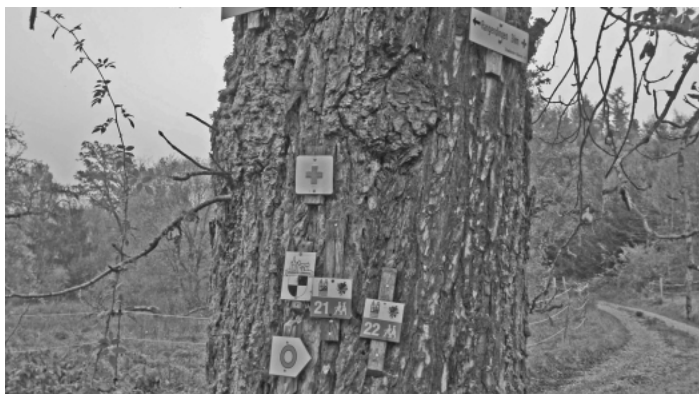
So sollte es jedenfalls nicht aussehen!