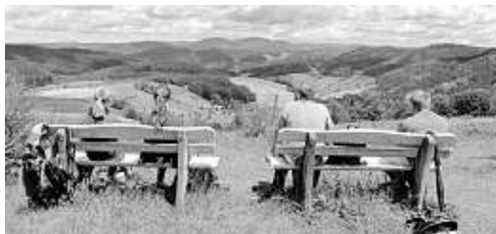
Herrlicher Ausblick beim Wandern rund um Mühlenbach!

Leider musste in Corona-Zeiten auf die sonst übliche gesellige Schlusseinkehr verzichtet werden.