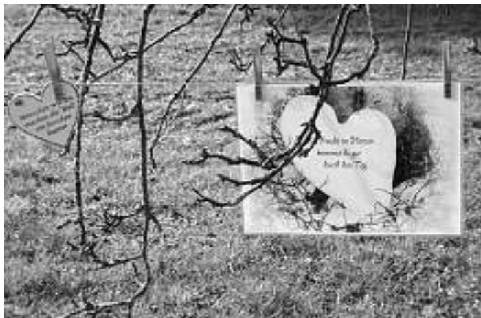
Ausschnitt des Herzensbandes im Mittel-tal

Nochmal herzlichen Dank an alle, die ein Herz aufgehängt haben und so zur allgemeinen Freude und zum vollen Erfolg beigetragen haben.