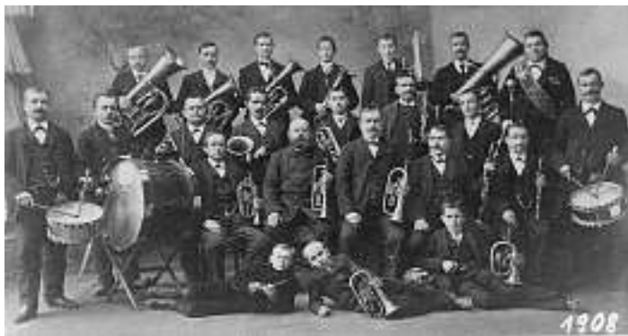
als Tambourmajor rechts hinten auf dem Foto von der Musikkapelle 1908