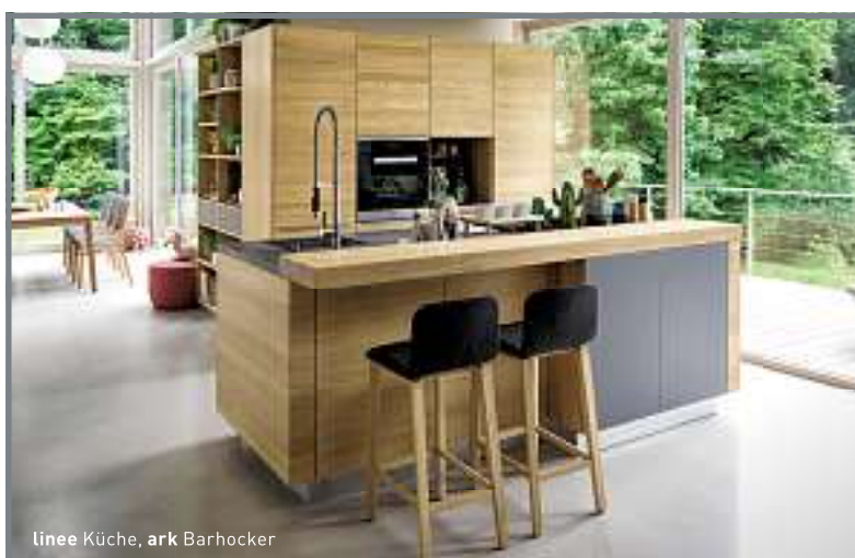
linee Küche, ark Barhocker