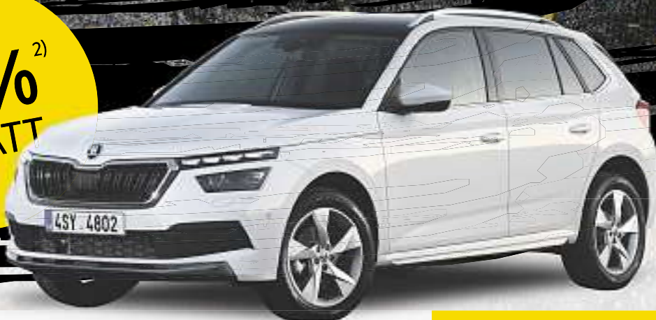
Abb. beispielhaft & zeigt Sonderausstattung.