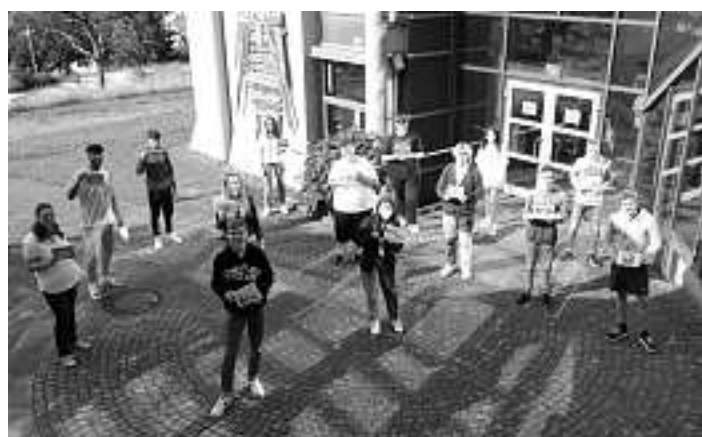
Die Schülerinnen und Schüler der Klasse 1BK1T präsentieren zum Abschluss des Schuljahres stolz ihre selbstgestellten Fotoalben.

Während einige Schülerinnen und Schüler die Möglichkeit nutzen und in einem zweiten Schuljahr die Fachhochschulreife erwerben wollen, geht der Großteil mit den erworbenen medientechnischen und gestalterischen Kenntnissen in eine Ausbildung.